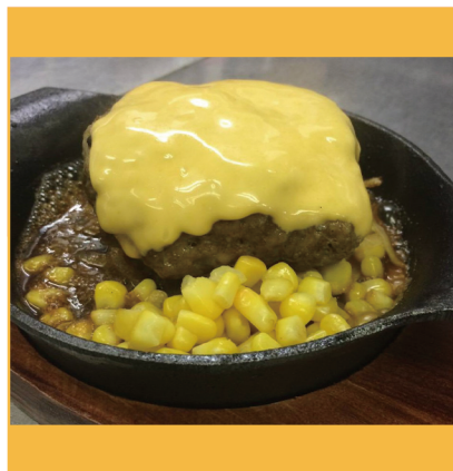
チーズハンバーグ 840円 (デミグラス・和風・ガーリック・わさび) 4種類のソースからお選びください。