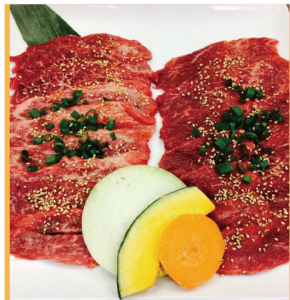
笑蔵盛 3400円 (カルビ・ロース)