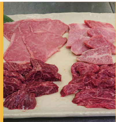
笑蔵上盛 4900円 (上ロース・上カルビ・特上カルビ・ハラミ・ロース) 仕入状況で変わります。

厳選された黒毛和牛の焼肉や手づくりハンバーグ・牛ホルモンなど上質なお肉を提供しております。 ご飯はもちろん多古米を使用！お弁当やお持ち帰りも承っております。 お店のアプリがダウンロードできます。Googleストア、アップルストアで「焼肉 笑蔵」と検索！