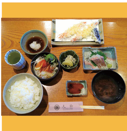
天婦羅定食 松 1750円 (天婦羅5品・刺身・サラダ・フルーツ)