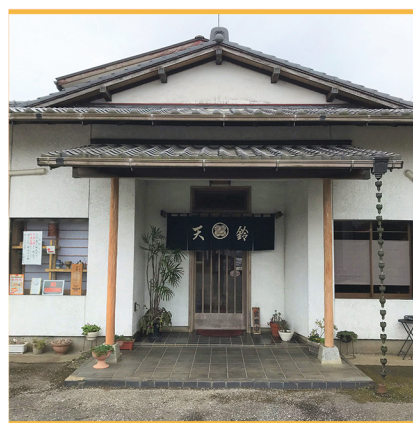
多古笹本線、飯土井橋際